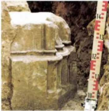
9. Városlőd, karthauzi kolostor. A kerengőből a káptalanterembe nyíló kapuzat gótikus lábazata. 1994.