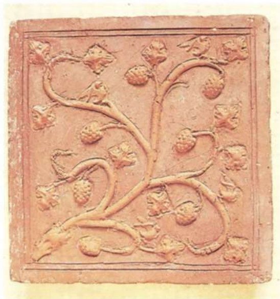
8. Városlőd, karthauzi kolostor. Szőlőindás díszítésű téglaburkolólap, 15. század második fele. 1994.